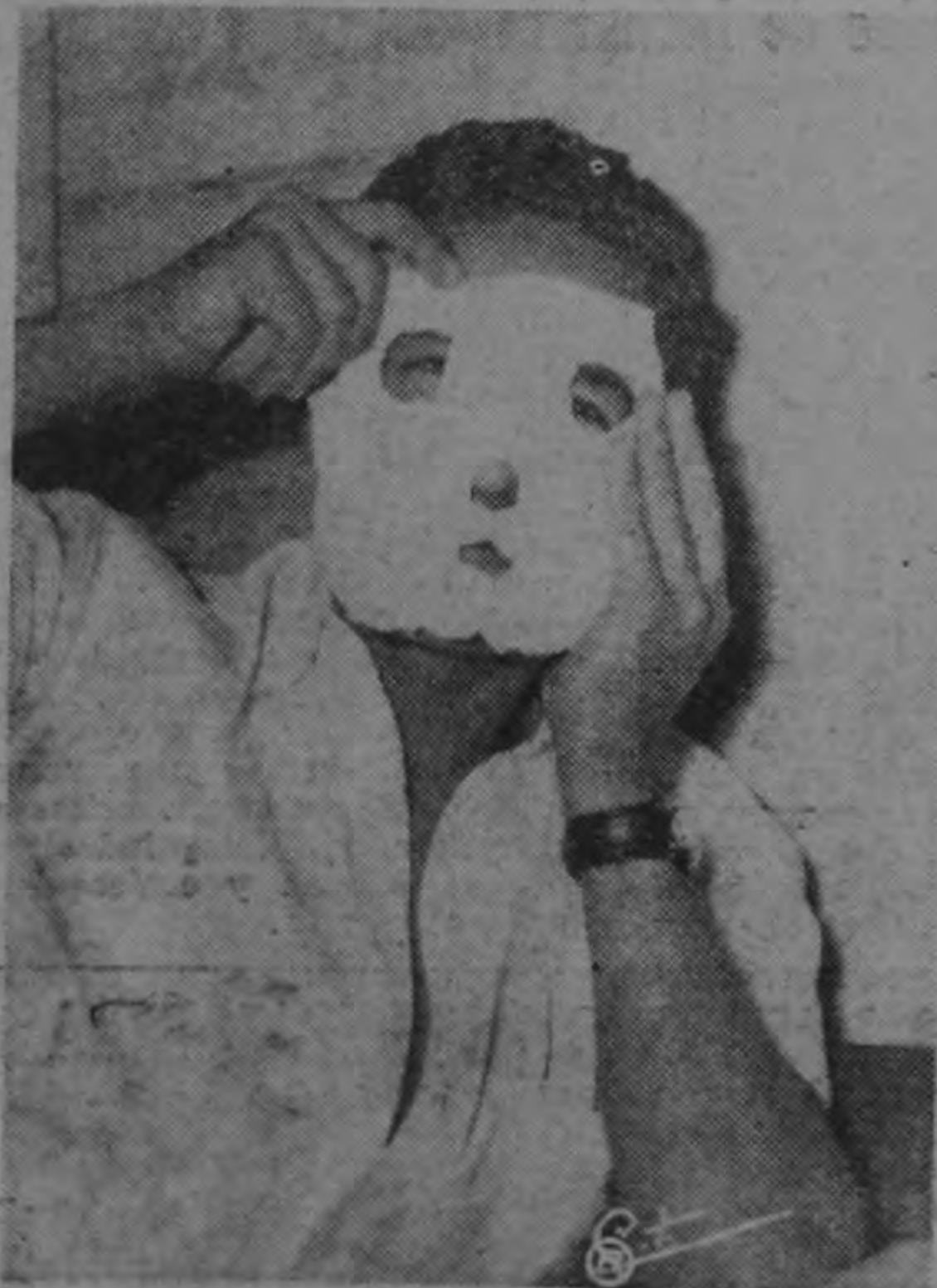
Las antecelas y oficinas de la Agencia Principal de Policía resultaron ayer estrochas para dar cabida a los numerosos detenidos —menores de uno y otro sexo— que fueron enviados por la Guardia Civil, apresados en la redada nocturna del martes. Ninguno se deja ver la cara, y uno de ellos hasta se ha improvisado una careta, en gesto de pudor que nuestro fotógrafo respetó en todos los casos, más aún por saberse que entre esas personas había algunas que habían sido llevadas por error.