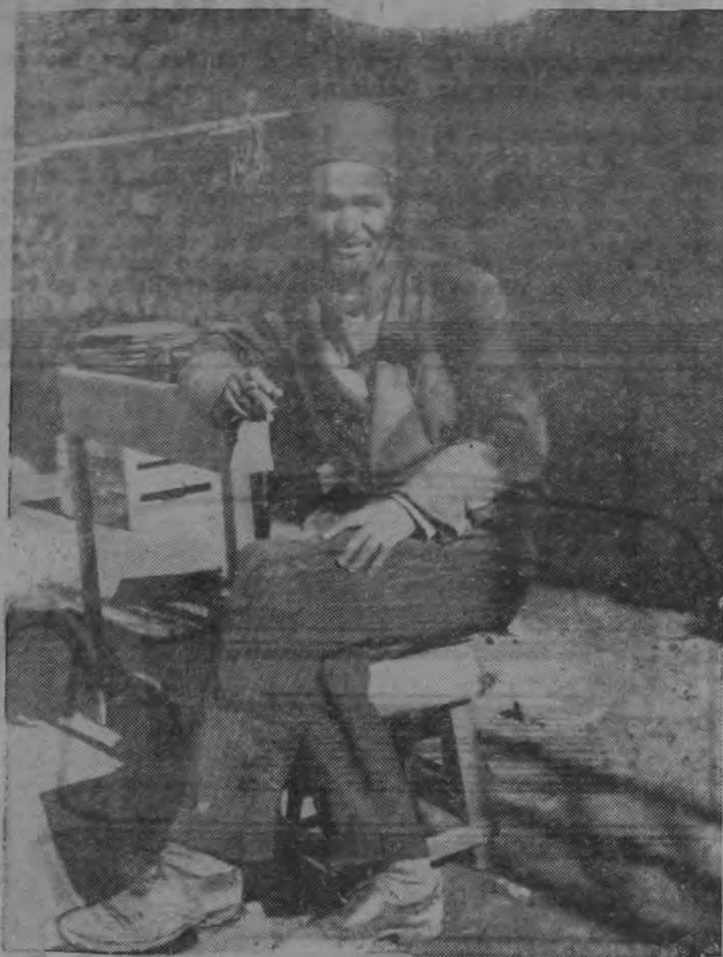
Este marroquí escribe cartas, se halla en su tienda situada en una calle y hace un provechoso negocio atendiendo a sus compatriotas analfabetos.

A la llegada de los Americanos a Marruecos surgieron complicaciones todavía mayores, siguiendo la tendencia de obtener la independencia del país. Tanto Francia