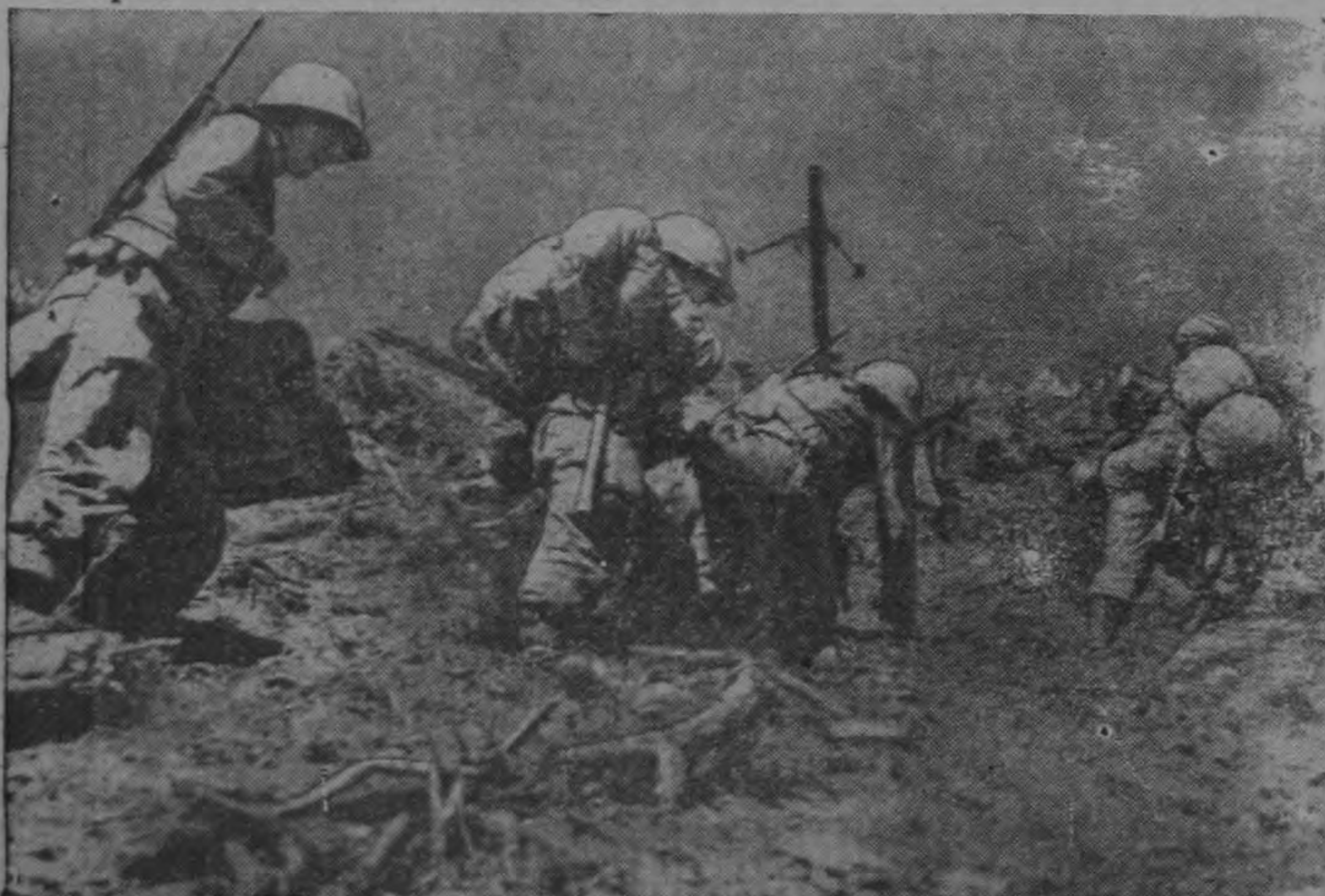
Atentamente cuidadas por las empinadas laderas de la Colina del Triángulo, en la Corea, tropas de la Séptima División Norteamericana se disponen a tomar posiciones en una altura arrebatada al enemigo en los recientes y cruentos combates.