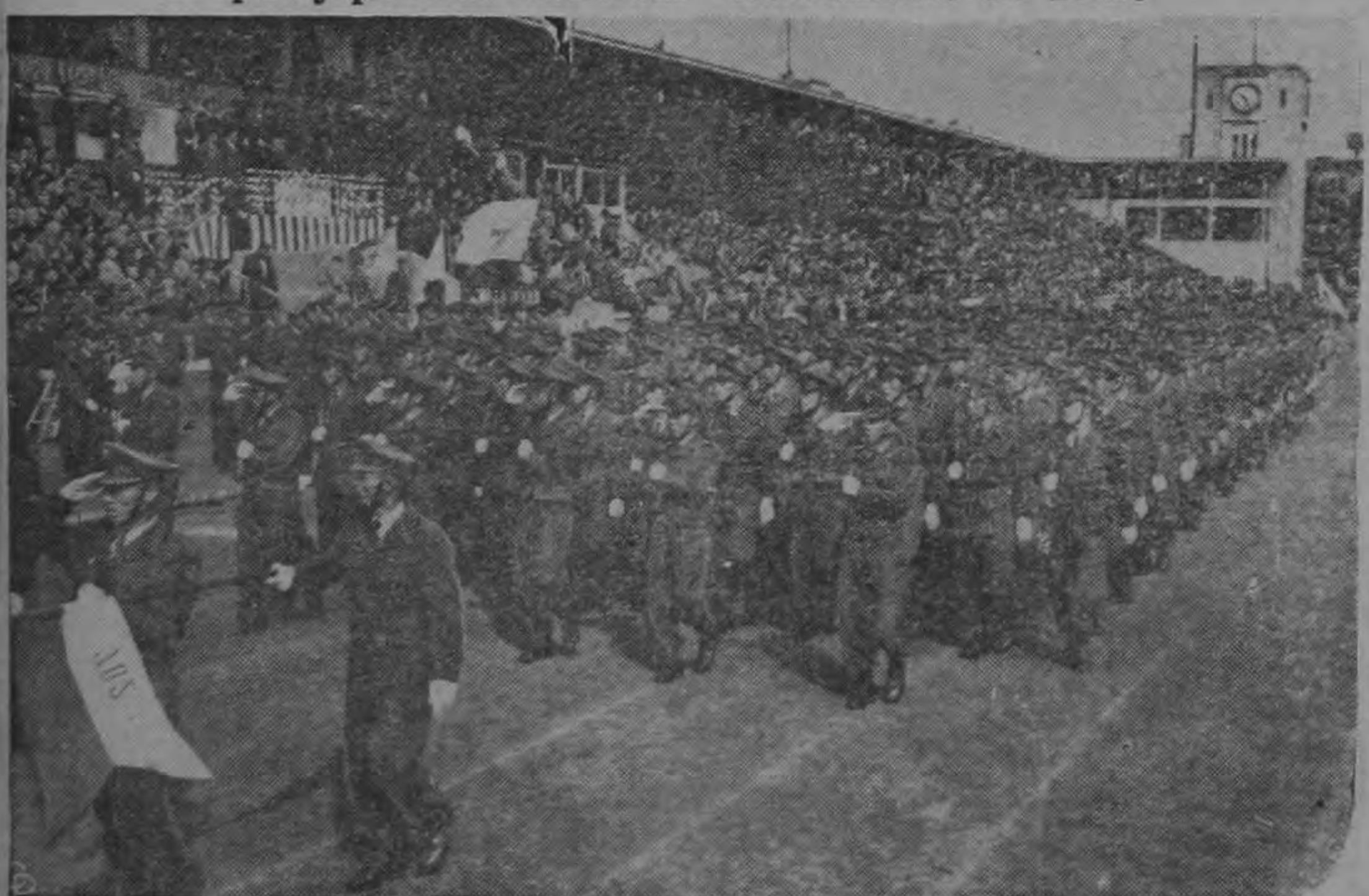
En el primer espectáculo militar de su clase desde que las islas fueron derrotadas en la Segunda Guerra Mundial, más de 4.000 soldados japoneses son revistados por el Primer Ministro Yoshida mientras desfilan por las calles de Tokio. La parada fué heraldo de la inauguración del Cuerpo de Seguridad Nacional de 110.000 hombres, considerado como el núcleo del nuevo ejército japonés. Unidades navales también hicieron su aparición.