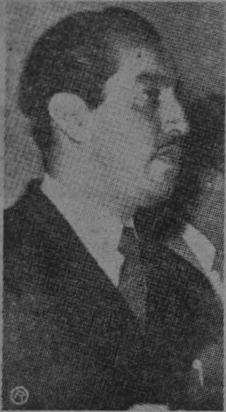
Leonardo Ruiz Pineda, dirigente político venezolano que ha caído víctima de las balas de la policía al servicio de la Junta Militar de Gobierno que impera en la Patria del Libertador Bolívar. (Información cablegráfica en la página 12)