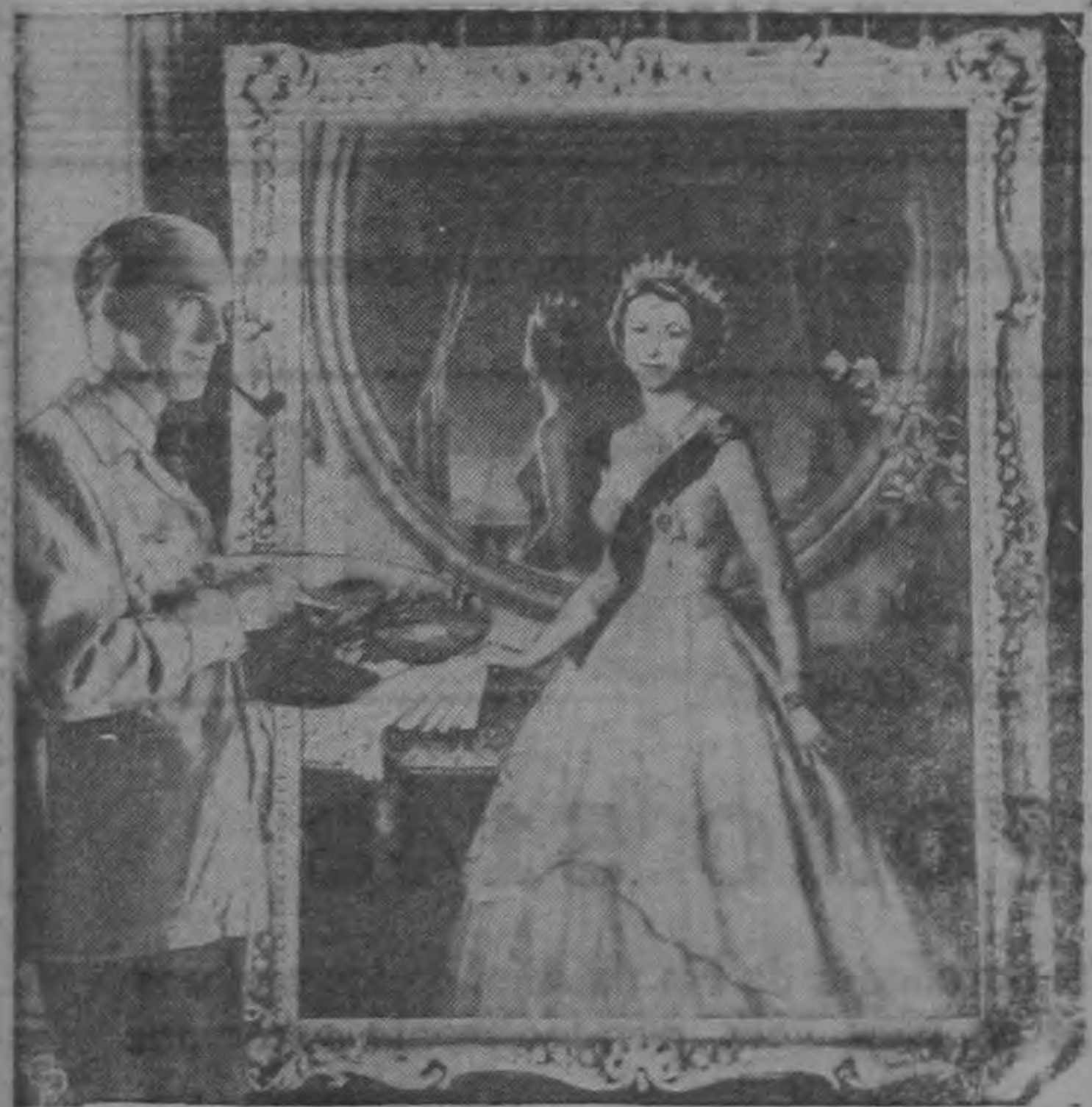
El notable pintor norteamericano Douglas Chandor aparece aquí en Londres junto a su retrato de la Reina Isabel II, el primero para el cual ha posado desde que subió al trono. La obra fué ordenada por la Sra. Franklin D. Roosevelt y será obsequiada a la Embajada Británica en Washington, en señal de la amistad de los Estados Unidos.