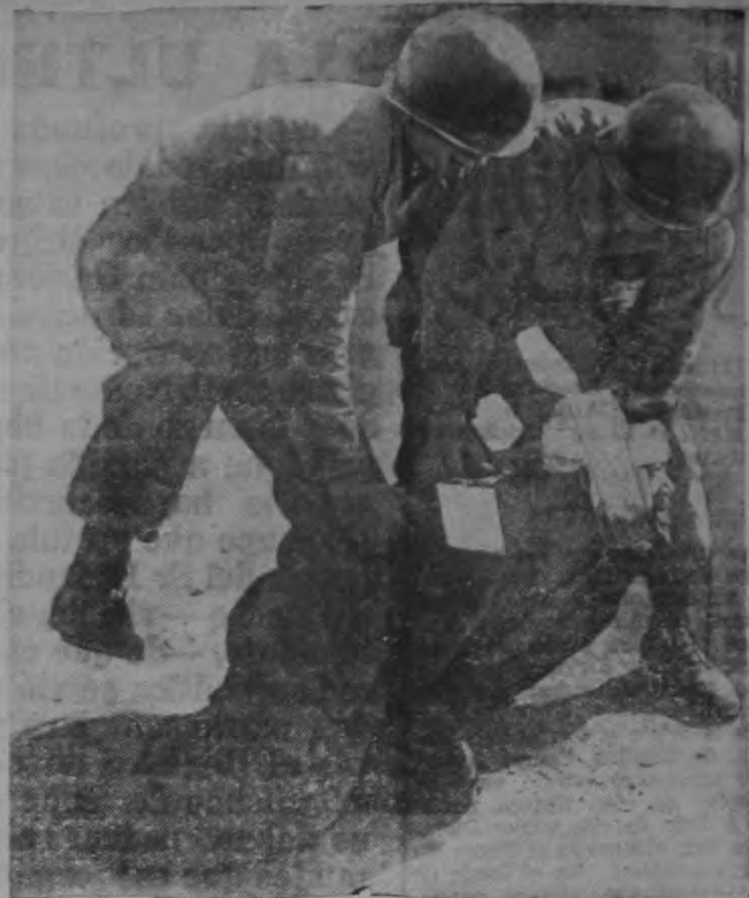
Otra baja en Corea durante la tremenda batalla que desde hace meses se viene librando en el triángulo de las colinas. El herido, después de haber sido convenientemente vendado, es conducido por dos miembros del cuerpo médico de campaña.

También son secretos los modos de financiar las actividades internacionales comunistas. El Cominform nunca ha hecho público su Presupuesto con lo cual se ha apartado también de la tradición de la Internacional Comunista que, hasta 1935, rendía cuentas a intervalos irregulares. El Comintern sostenía que la mayor parte de sus ingresos procedían de las cotizaciones de sus partidos afiliados. Quien más pagaba era el Partido Comunista ruso, porque en el período entre las guerras tenía muchísimos miembros más que todos los otros Partidos. En 1934 los Comunistas de la Unión Soviética eran cuatro veces más que los del mundo "capitalista". De modo que el 80% de las cuotas de afiliación los pagaban ellos, si no procedían directamente del Presupuesto del Estado. En realidad la contribución rusa era todavía mayor, porque muchas de las secciones del Comintern incluso recibían sus subsidios. El Presupuesto del Comin-